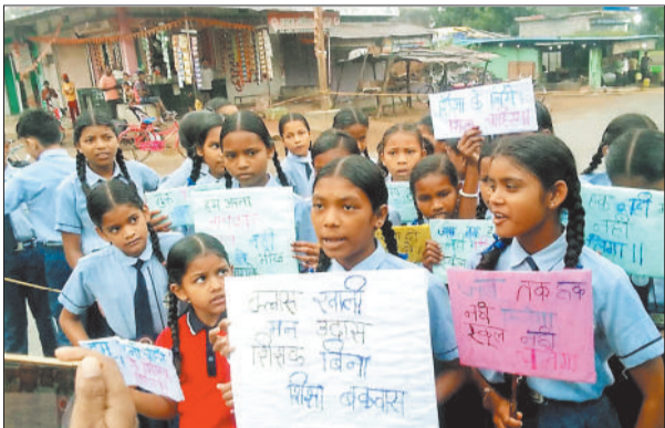
सड़क पर प्रदर्शन करती छात्राएं।