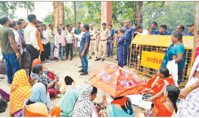
प्रदर्शन करते भूविस्थापित।

छत्तीसगढ़ किसान सभा और भूविस्थापित रोजगार एकता संघ ने वर्षों पुराने भूमि अधिग्रहण के बदले लंबित रोजगार प्रकरण, मुआवजा, पूर्व में अधिग्रहित जमीन की वापसी, पुनर्वास गांव में बसे भूविस्थापितों को काबिज भूमि का पट्टा देने आदि मांगों को लेकर मोर्चा