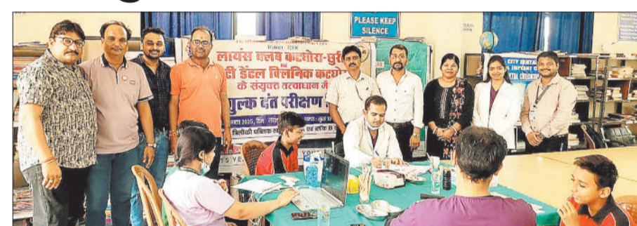
शिविर में उपस्थित चिकित्सक व लायंस क्लब के पदाधिकारी।

दी इंटरनेशनल एमोसिएशन ऑफ लायंस क्लब से सम्बंधित संस्था लायन्स क्लब कटघोरा छुरी शुरू से ही नगर में हो रहे सामाजिक गतिविधियों के लिए जानी जाती रही है इसी बीच सिटी डेंटल हॉस्पिटल कटघोरा के सयुक्त तत्वाधान में शिविर में उपस्थित चिकित्सक व लायंस क्लब के पदाधिकारी।