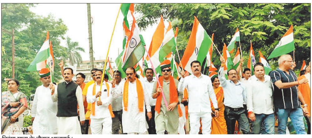
तिरंगा यात्रा के दौरान भाजपाई।