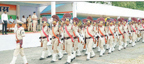
परेड की सलामी लेते पुलिस के जवान।

स्वतंत्रता दिवस पर आयोजित होने वाले परेड और सांस्कृतिक कार्यक्रमों के अंतिम रिहर्सल व तैयारियों को परखा। उन्होंने स्वतंत्रता दिवस के कार्यक्रम के दौरान सभी प्रोटोकॉल का पालन