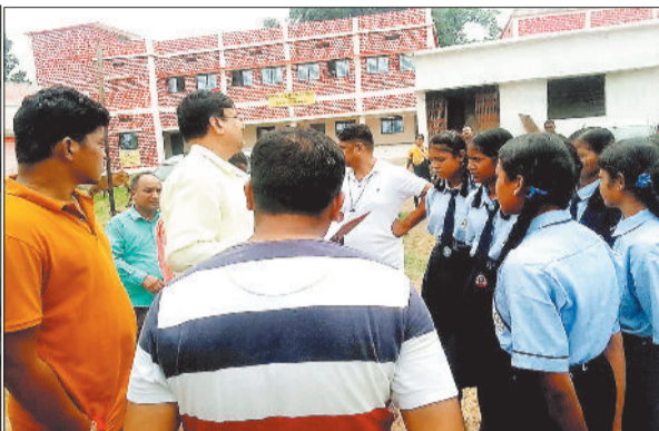
छात्राओं से चर्चा करते अधिकारी।